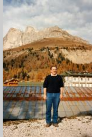
Das waren noch Zeiten...